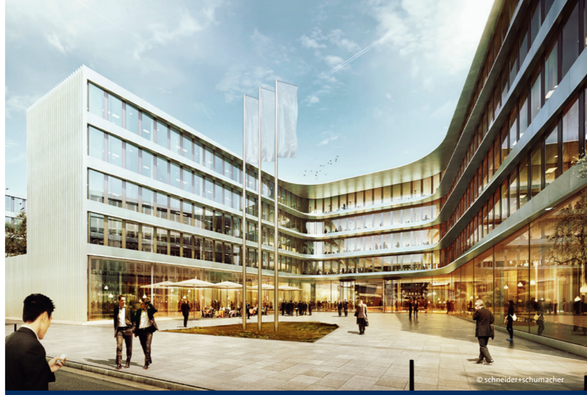
Allianz, Projektentwickler: Corpus Sireo Real Estate