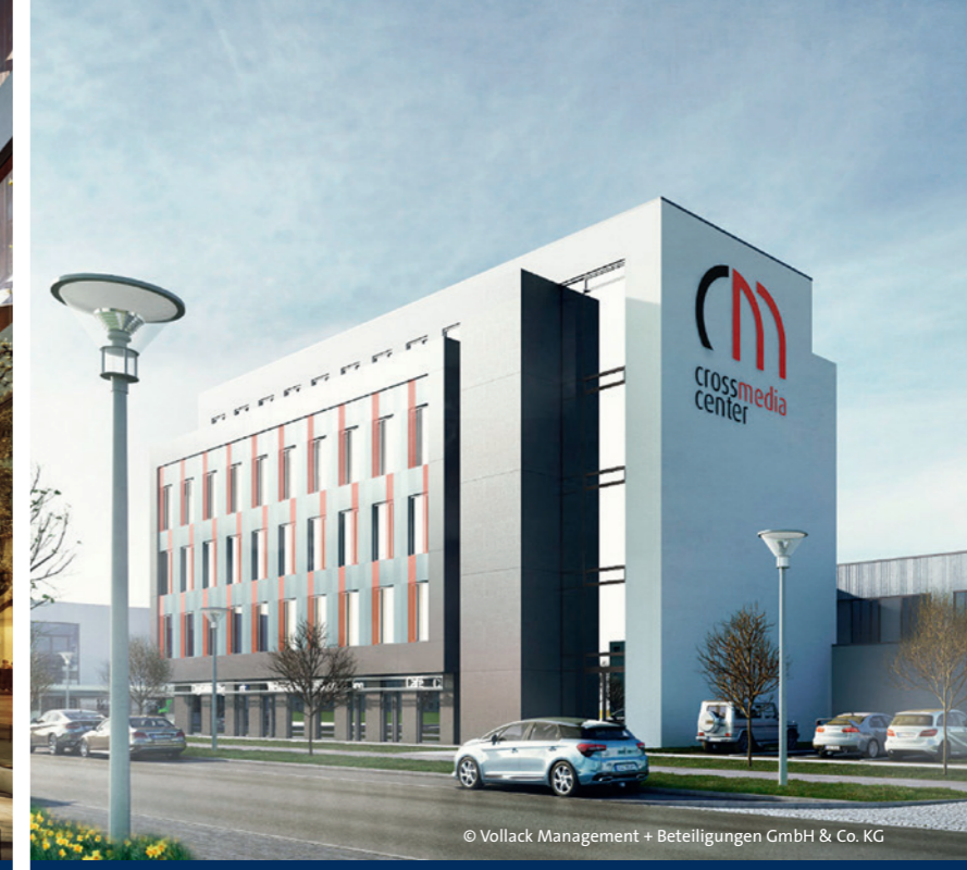
Cross Media Center (CMC)

Ende 2015 konnte durch den Abschluss einiger bemerkenswerter Verträge entlang der Magistrale Rudower Chaussee die Erfolgsgeschichte des Standorts weitergeschrieben werden.