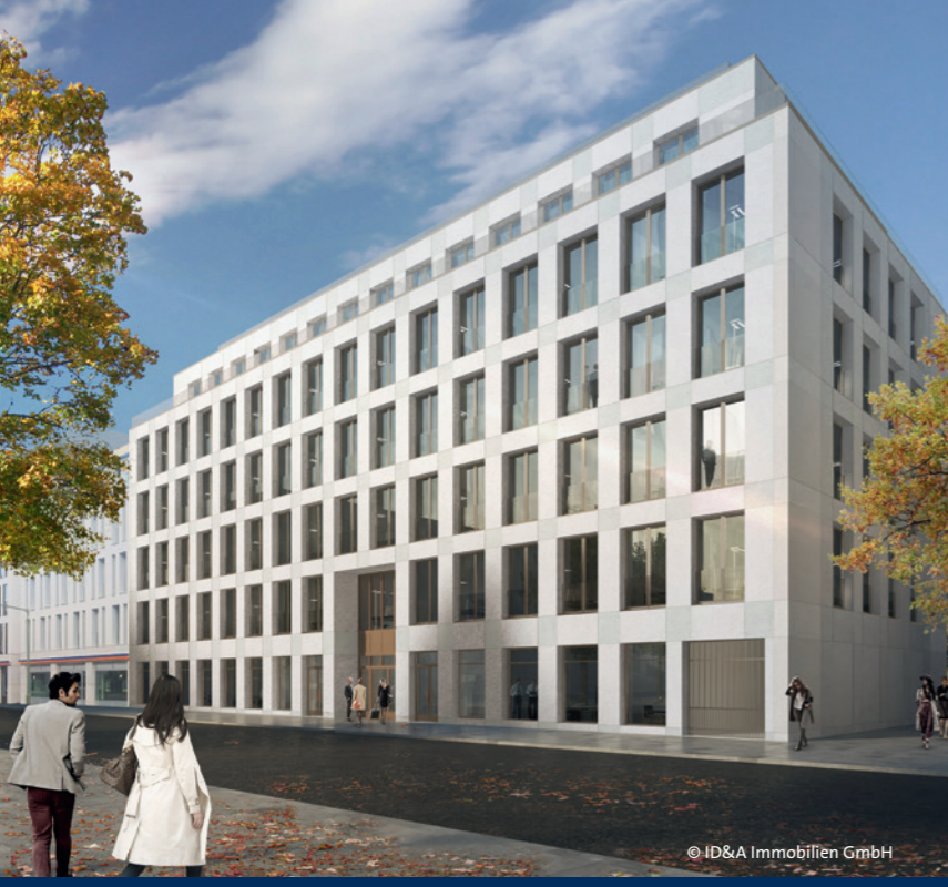
Air Campus Adlershof: Erweiterung Straße Am Studio