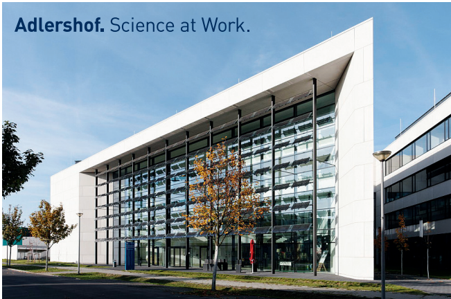
Adlershof. Science at Work.