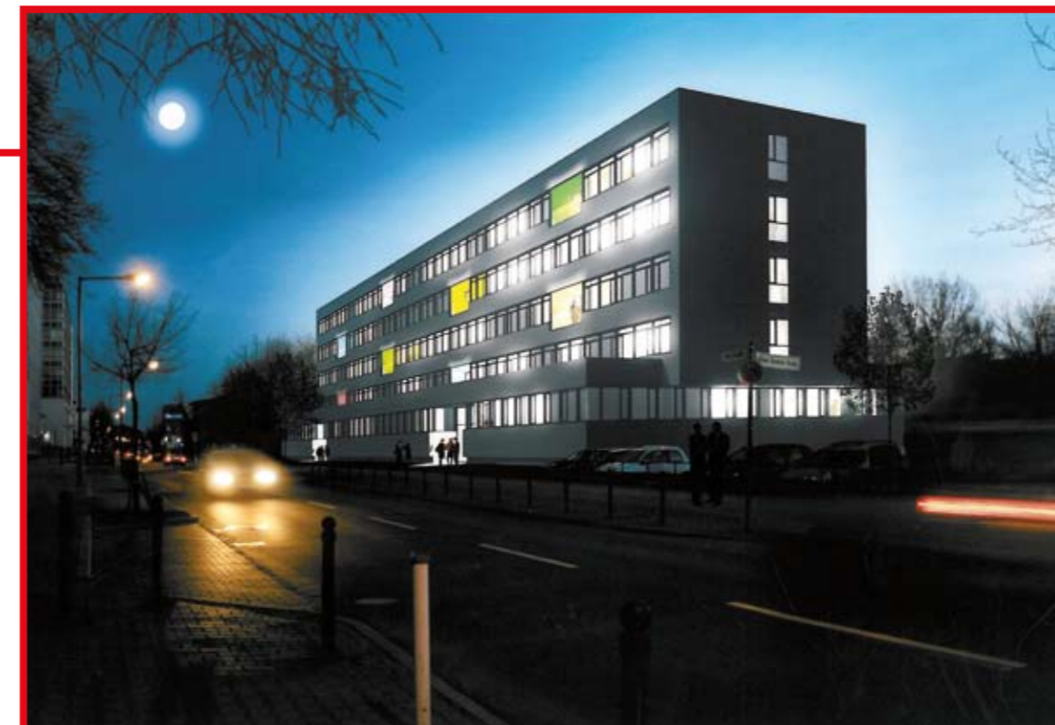
Am Studio 2